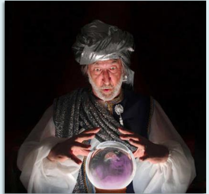
Illustratie: © EvoBuzz