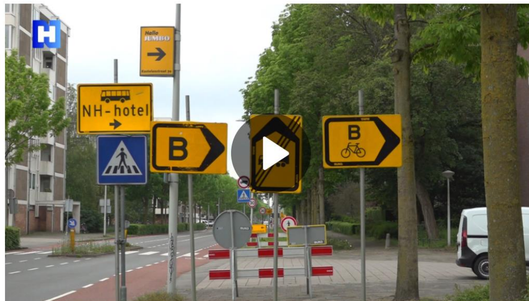
Verkeersborden - NH Nieruwe

met 136 verkeersborden. Een deel daarvan zijn omleidingsborden vanwege werkzaamheden aan de aangrenzende Van Leijenberghlaan. Een ander deel wijst de weggebruikers op de nieuwe maximumsnelheid van 30 km/u. Bij omwonenden rijst de vraag; hoeveel nut hebben al die borden?