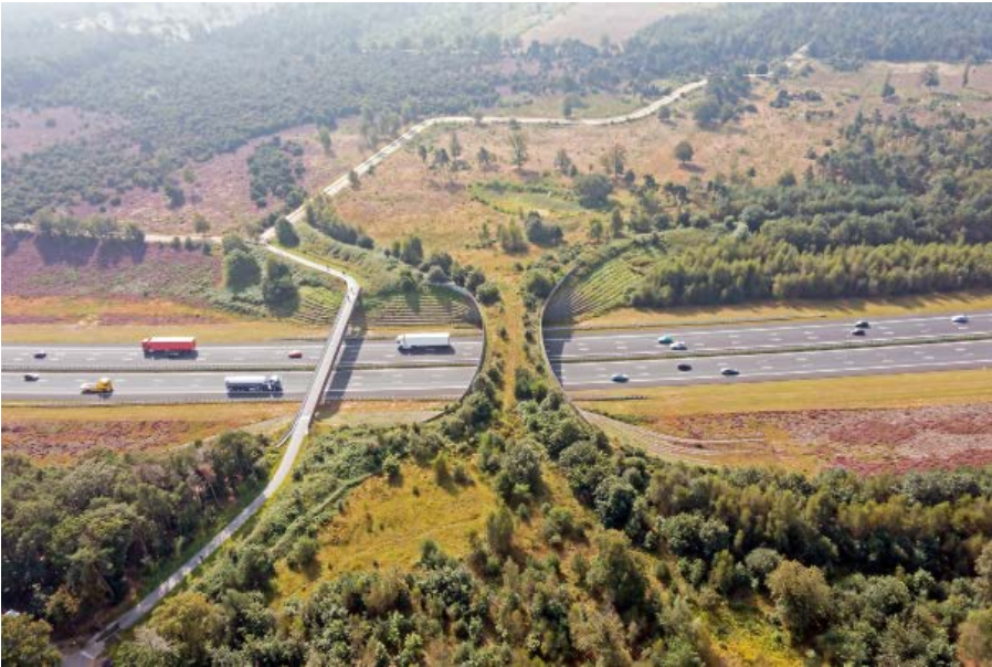
Doel is duurzaamheid te laten landen in de RAW-systematiek.

sneller laten stollen. Maar daar ligt wel een spanningsveld, erkent De Water. Rondom duurzaamheid spreek je al snel over innovaties en nee – die zijn per definitie nog niet standaard. Hij komt met een illustratie. “Je ziet hier de rood-witte balk; dat is de huidige standaard bij contractafspraken. Daarboven zit nog een groene balk; in dat gebied zitten de koplopers. Het is aan ons, aan CROW, om die goede voorbeelden van koplopers te bespreken met de werkgroepen en van daaruit RAW te voorzien van duurzame alternatieven.” Dat vraagt tijd: een best practice is nog geen standaard. “Maar als de werkgroep vanuit