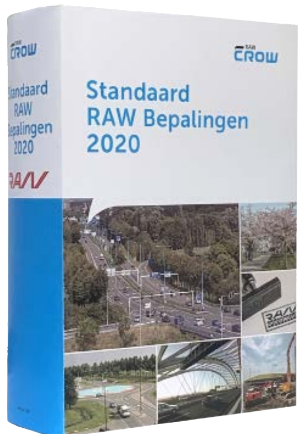
De RAW-bepalingen zijn een begrip in de gww-wereld.

Deze best practices komen ook op het platform RAW.nl. Daar is ruimte voor zowel goede als slechte ervaringen, vertelt De Water. “Ja, die behoefte is er zeker. Tijdens de InfraTech kregen we daar bij de CROW-stand veel vragen over vanuit gemeenten en provincies.” Uiteindelijk is het doel om binnen RAW zo snel mogelijk tot meer duurzame standaarden te komen. Anders gezegd: goede ervaringen